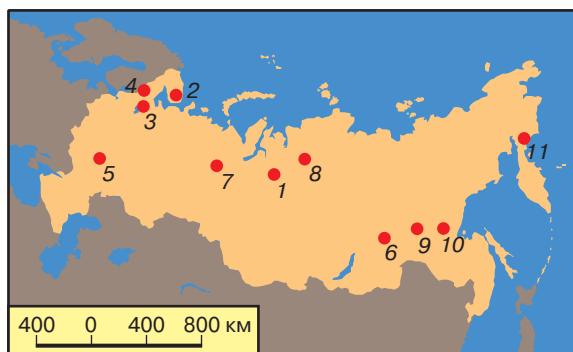
Рис. 1. Схема размещения основных промышленно-генетических типов месторождений МПГ России: 1 – Норильско-Талнахская группа, 2 – Федорово-Панское, 3 – Бураковское, 4 – Онежское, 5 – Тимское, 6 – Сухоложское, 7 – Денежкин Камень, 8 – Гулинское, 9 – Инаглинское, 10 – Кондерское, 11 – Вывенское

Важной особенностью, имеющей глобальный характер, является размещение наиболее крупных платиноносных провинций и рудных районов России в ее арктической зоне [2]. Помимо известных сульфидных платиноидно-медно-никелевых месторождений Норильско-Талнахского рудного района, являющихся сейчас главной минерально-сырьевой базой России, в этой зоне выявлены другие потенциально перспективные провинции. В их числе: 1) Таймыр-Норильская, в пределах которой помимо эксплуатируемых сульфидных платино-медно-никелевых месторождений открыты малосульфидные платинометалльные (Pt до 1,2 г/т, Pd до 64 г/т, Rh до 0,95 г/т) руды; 2) Северотаймырско-Североземельская с широким развитием платиноносных (до 3,1 г/т Pt и 3,9 г/т Pd) интрузий, речных и прибрежно-морских россыпей и золото-платиноносных конгломератов (о-в Большевик, п-ов Челюскин); 3) Западно- и Восточно-Таймырская провинции с малосульфидными платиноносными и платиносодержащими сульфидными горизонтами