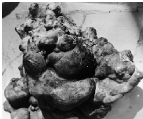
Рис. 2. Морфология сложно построенной железо-марганцевой конкреции из Тихого океана. 1/10 натуральной величины.

Обычно конкреции содержат ядро, сложенное каким-либо инородным телом (часто это обломки вулканических пород), которое окаймлено оболочкой Fe-Mn-оксидов. По морфологии конкреции очень разнообразны: это сферические, эллипсоидальные, уплощенные, таблитчатые, полигональные, бугорковидные и более сложные образования (рис. 2). Железо-марганцевые минералы образуют налеты, агглютинации (грозди ядер, покрытые тонкой инкрустацией Fe-Mn-оксидов), конкреции и корки. Эти различные формы выделений часто переходят друг в друга. По структуре поверхности конкреции обычно представляют сосковидные образования (полусферические выступы), которые иногда осложнены маленькими бугорками, или “гусиной кожей”. На поверхности конкреций микроскопическими исследованиями выявляется обилие органогенных структур (например, бентосных — донных фораминифер рода Saccorhiza , которые в