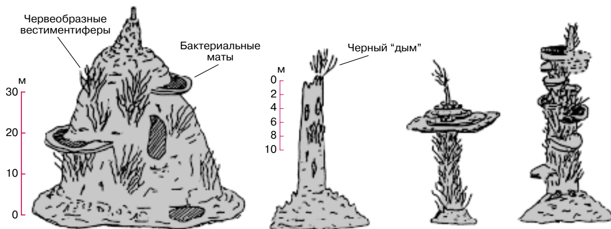
Рис. 1. Морфология высокотемпературных гидротермальных сульфидных построек [2]

На удалении от сульфидной постройки обнаружены поля многочисленных гидротермальных холмиков (высотой от 1 до 20 м, диаметром в основании от 20 до 50 м), сложенные осадочным материалом, переслаивающимся с гидротермальным веществом. Содержание рудных компонентов в холмиках незначительное. В Галапагосском рифте встречены также поля с гидротермальными трубами, практически полностью состоящими из аморфного кремнезема и напоминающими губки или пчелиные соты с многочисленными пустотами и кавернами. Изучение изотопного состава кислорода показало,