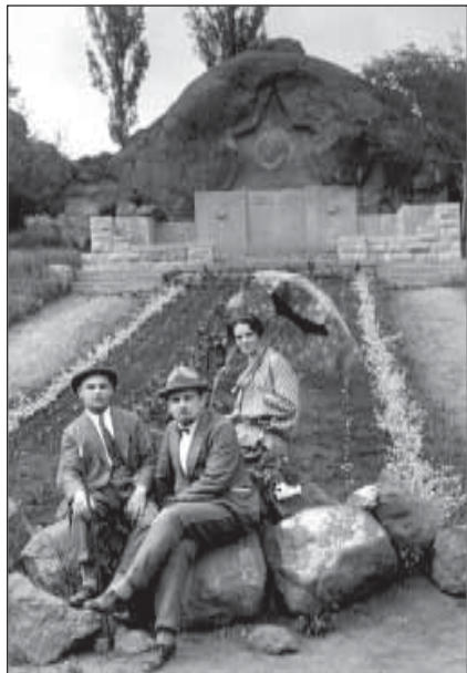
Август 1937 г. В г. Кисловодске.