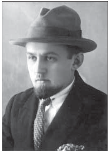
Начало 1930-х гг. Доцент Грозненского нефтяного института.