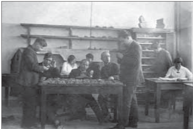
1936 г. В кабинете камеральной обработки кафедры динамической геологии ПГУ.