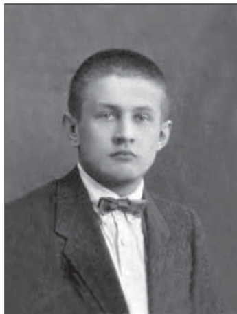
1920-е гг. Студент Днепропетровского горного института.