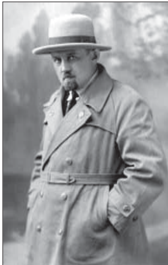
1936 г. Декан геологического факультета ПГУ.