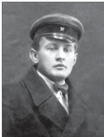
1927 г. Инженер треста «Грознефть», г. Грозный.