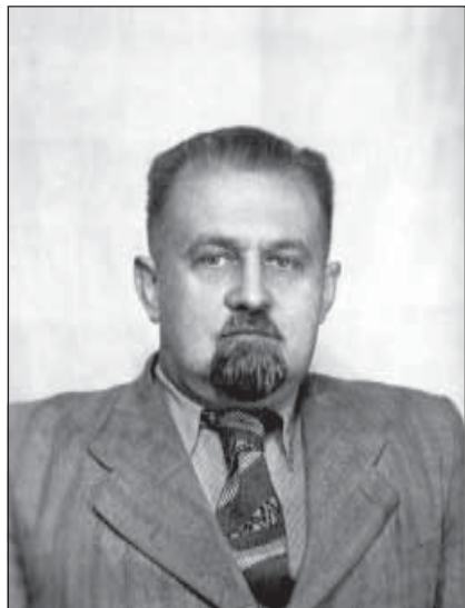
1950 г. Проректор ПГУ.