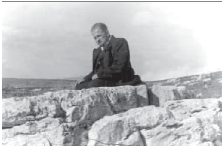
1950 г. В Крыму, на Ай-Петри.