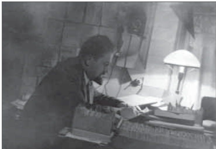
Конец 1930-х гг. Дома, в кабинете, за рабочим столом.