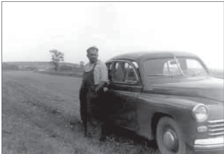
Лето 1951 г. Поездка в г. Кунгур на своей «Победе».